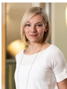
Bettina Pauschenwein JW Bundesvorsitzende